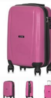
MAŁA WALIZKA OCHNIK RÓŻOWA